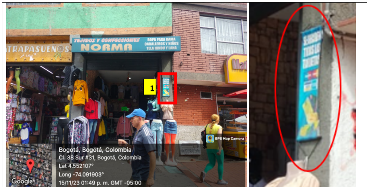
En la cual se evidencia un (1) elemento de PEV identificado con el número 1, el cual no se encuentra totalmente adosado a la fachada (volado).